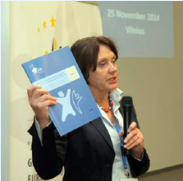
Virginija Langbakk, die Direktorin des EIGE, bei der Veranstaltung zur Veröffentlichung des Berichts über administrative Datenquellen zu geschlechtsbezogener Gewalt in der EU. EIGE, 5. November 2014